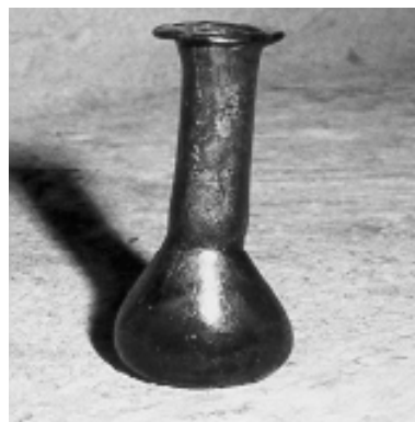
Flacon, Epoque gallo-romaine Vitrine 48

En 2000, 893 œuvres ou objets d'art ont été saisis, contre 841 en 1999. L'année 1999 est marquée par l'interception de pièces présentant un intérêt archéologique.