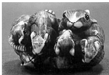
Rate et ses petits, figurine en ivoire, netsuke, 20 e siècle Vitrine 46