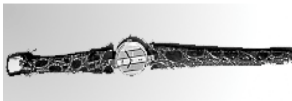
Contrefaçon d' une montre Cartier, saisie A côté de la vitrine 48

Un contrefacteur peut-être condamné jusqu'à deux ans de prison avec une amende de 150 000 euros.