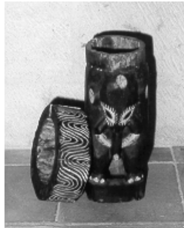
Statuette évidée pour le trafic de drogue saisie vitrine n°47

L'observation et la déduction ont permis plus d'une fois de déjouer les ruses des passeurs : personnes anormalement stressées, ustensiles de toilette bas de gamme dans des bagages de luxe... Dans les aéroports la technique de recherche utilisée par les douaniers passe également par le ciblage de passagers « à risque », c'est-à-dire provenant de pays producteurs de drogue (pays d'Amérique du Sud, pays asiatiques...).