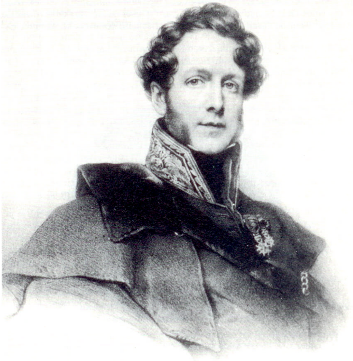
Portrait de Boucher de Perthes par Grévedon