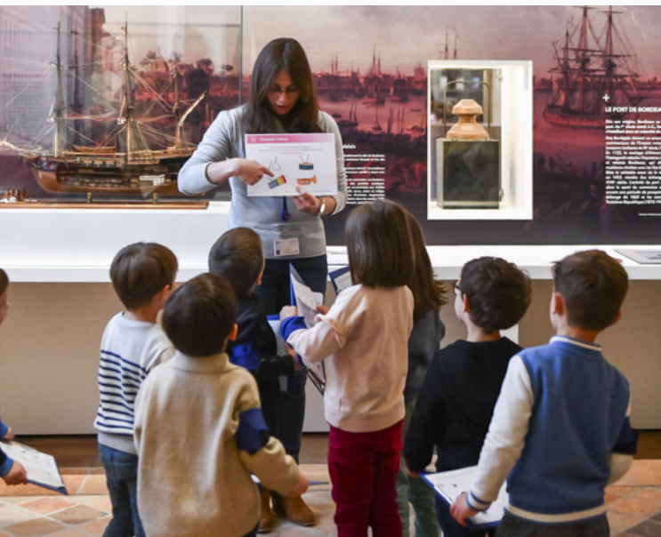
graphisme © Freak Fabric 2019

Plusieurs thèmes liés aux missions des douaniers sont abordés. Le contenu de chaque visite est adapté à l'âge des enfants.